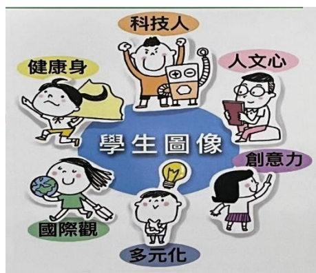
圖一：新工學生圖像

「一切為師生、師生為一切；建構教師專業自主；維護學生受教權益」兼重科技與人文發展的溫馨校園，讓老師能努力用心去發現並發展學生的特質與專長，讓每個學生的特質與專長能被看得到，能有被培養的機會。